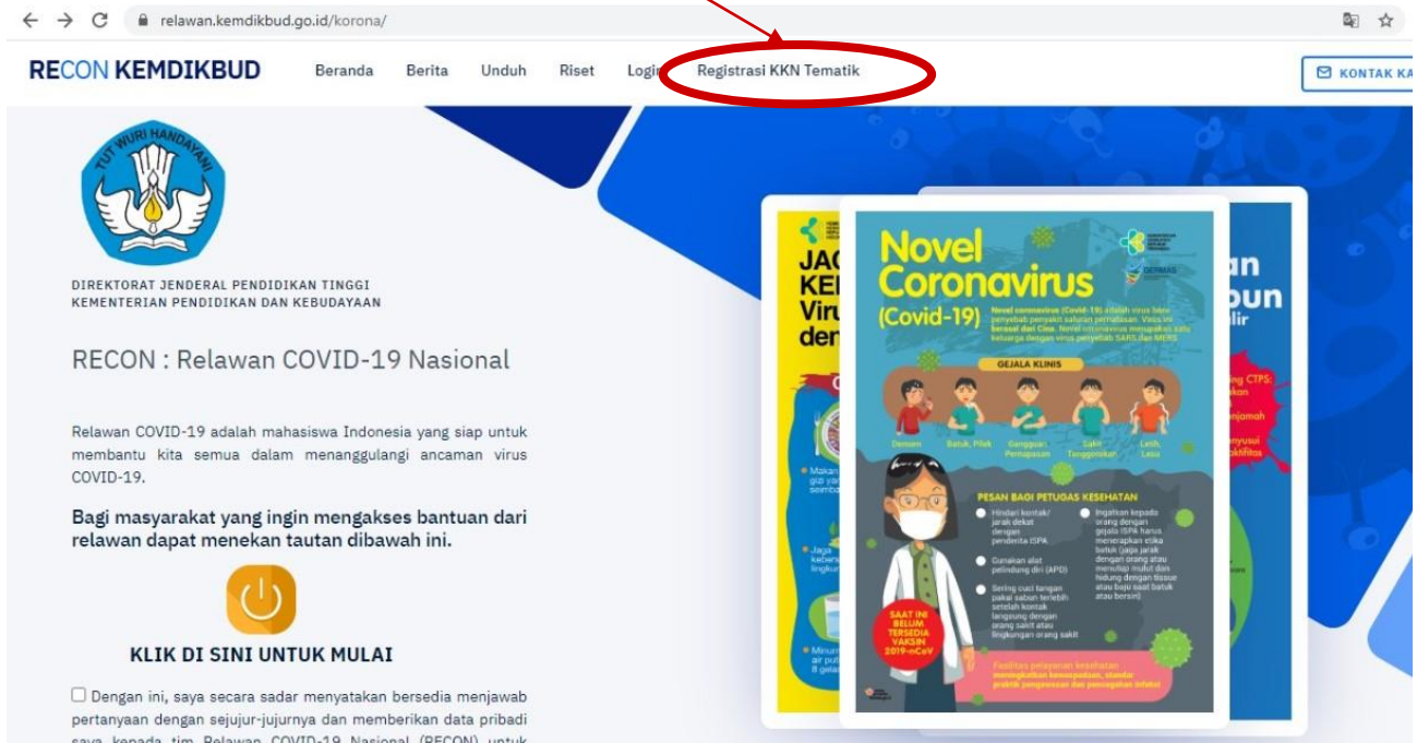
Gambar 2. Registrasi KKN Tematik

Setelah langkah 1 selesai, silahkan masuk ke link: https://relawan.kemdikbud.go.id/korona/ kemudian klik menu Registrasi KKN Tematik seperti gambar 2 berikut. Isi dengan lengkap semua data yang ditampilkan di menu tersebut.